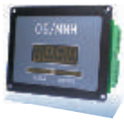
ПРИБОР ИНДИКАЦИИ ПИ-1